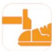
200 JOULE TOECAP