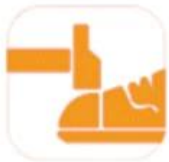
200 JOULE TOECAP