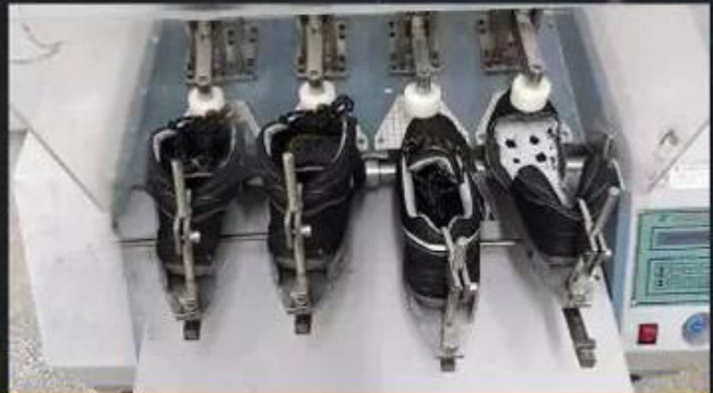
Flex Tester \geq 36,000 T