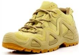
Safety Work Shoes

Link to PPE products website https://china-workwear.com