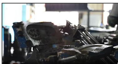
4. Open The Mould