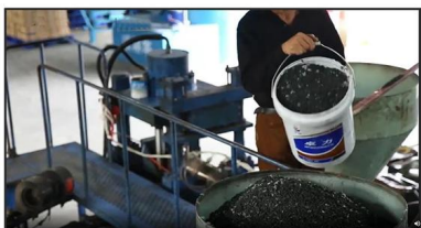
1. Mixing Materials