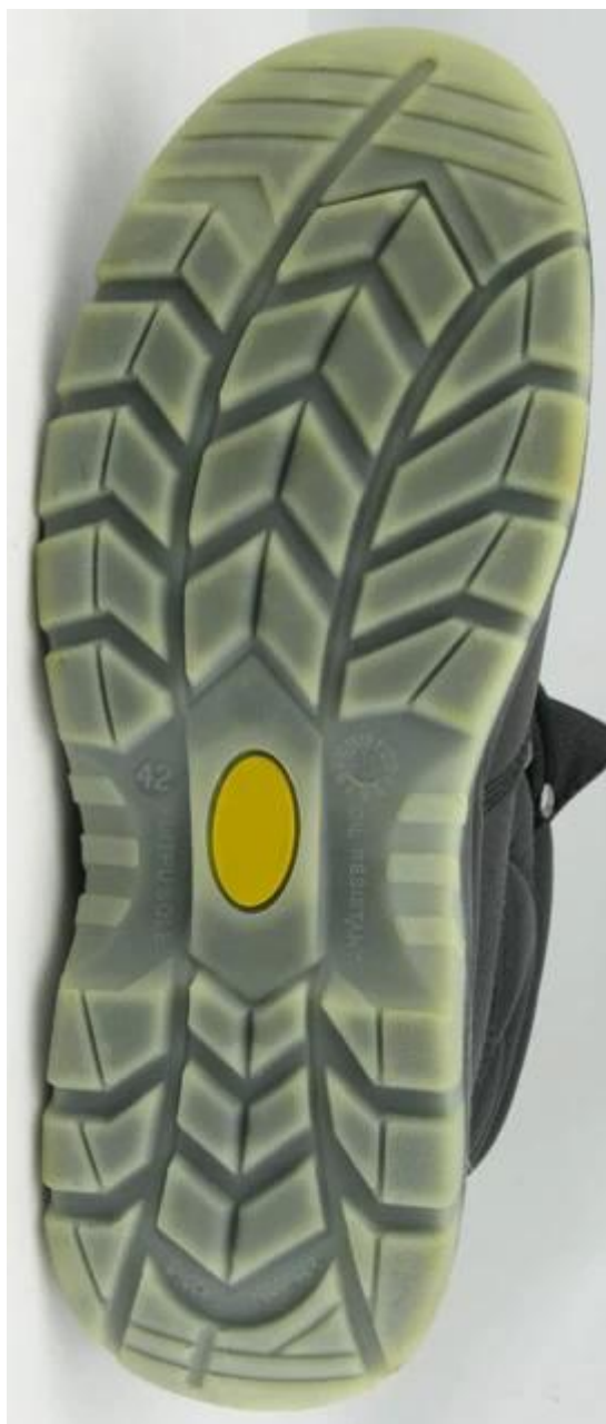
Scarpe di sicurezza unico modello di spettacolo: