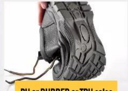
PU or RUBBER or TPU soles