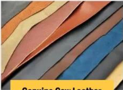
Genuine Cow Leather