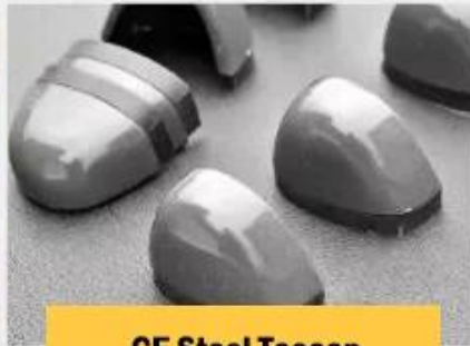
CE Steel Toecap