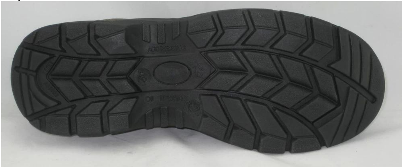
scarpe di sicurezza industriale unico modello di spettacolo: