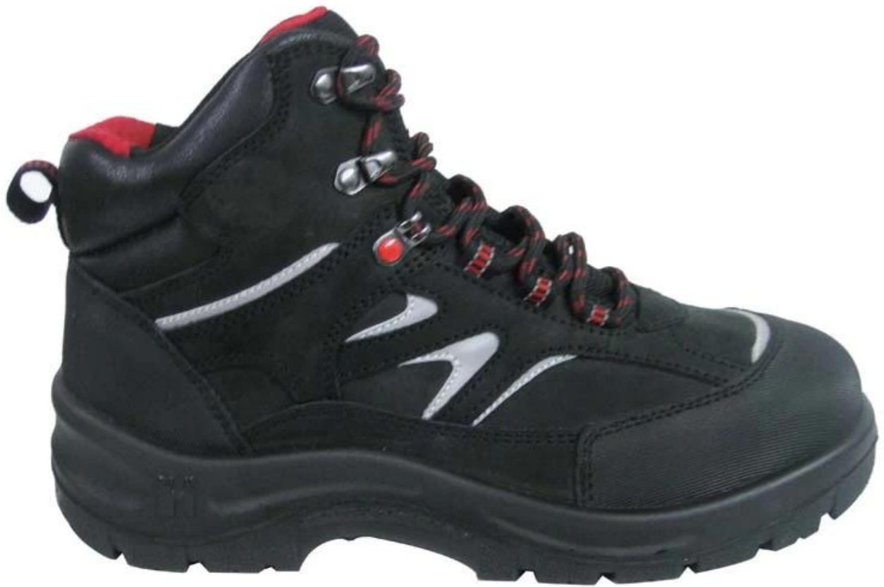
3014 scarpe di sicurezza in pelle scamosciata Sole Mostra: