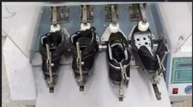
Flex Tester \geq 36,000 T