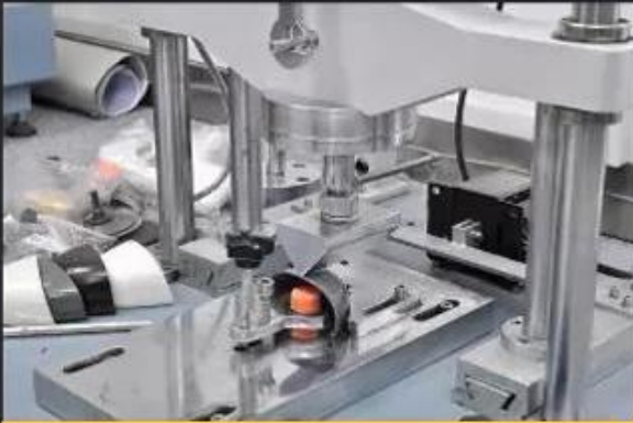
Toecap Test \geq 200 Joules