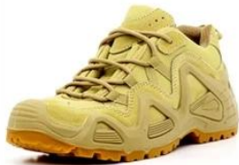
Safety Work Shoes

Link to PPE products website https://china-workwear.com