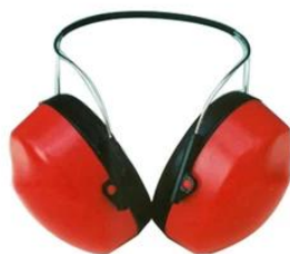
Ear muff/ Plugs