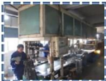
Heat - Setting