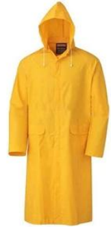
Rain Coat/ Suit