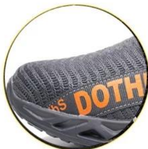
Breathable 3D fly knit fabric