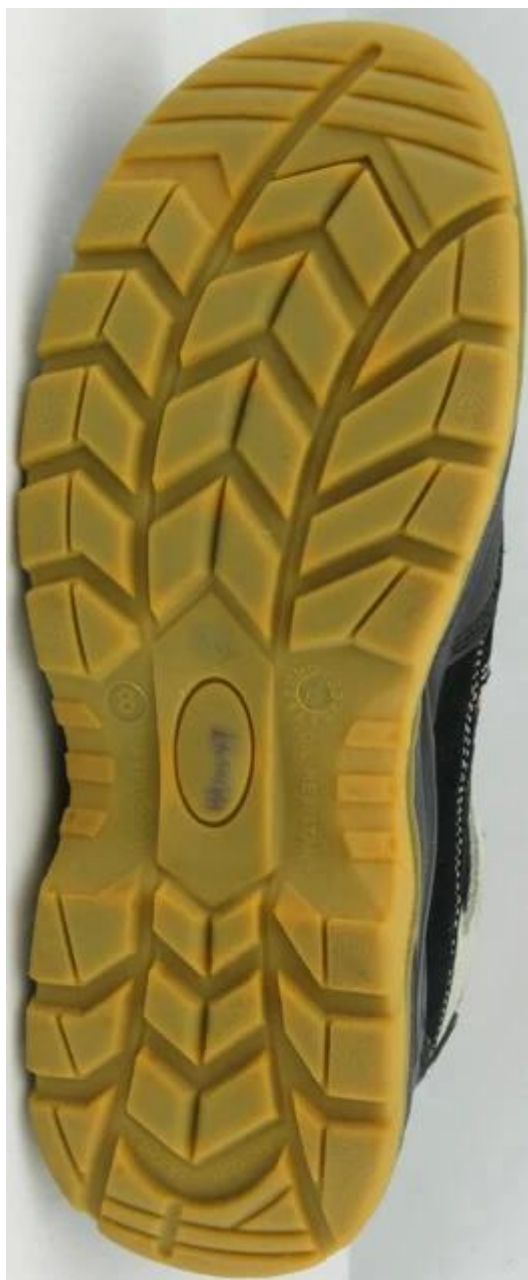
Scarpe di sicurezza unico modello di spettacolo: