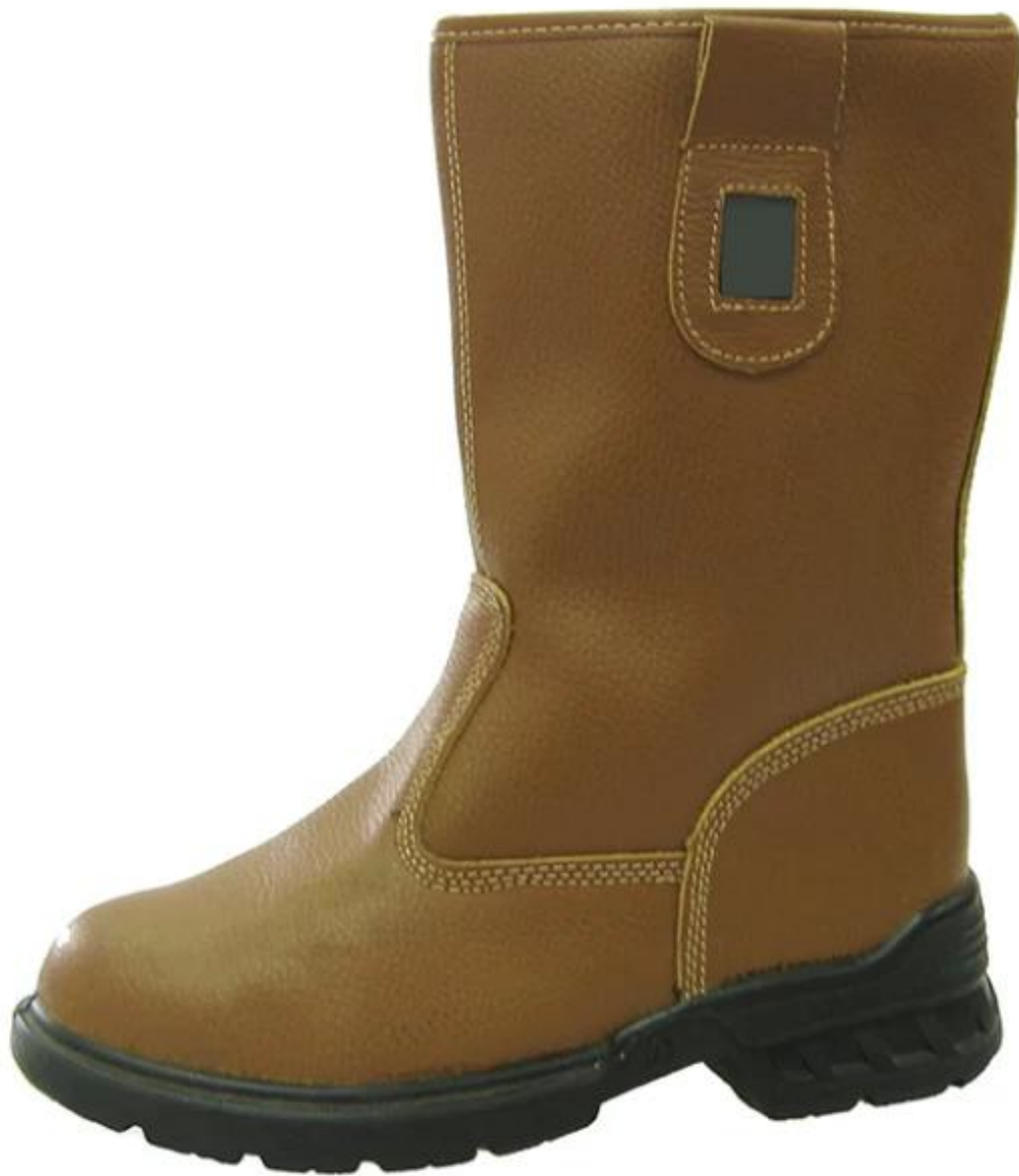
Stivaletti alti di lavoro suola Show: