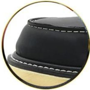
Waterproof cow genuine leather upper

Removable metatomical HI-POLY footbed provides long-lasting underfoot support and comfort.