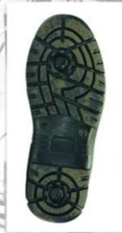
Sole style: 1000