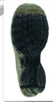
Sole style: 4000