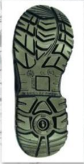
Sole style: 2017