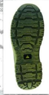
Sole style: 2016