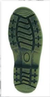
Sole style: 6000