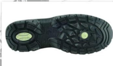
Sole style: 8080