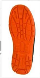
Sole style: 8000