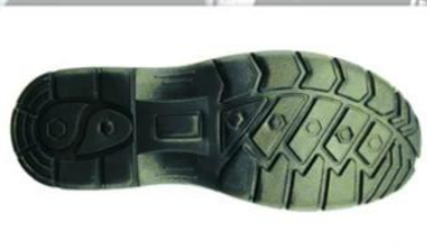
Sole style: 1001