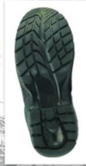
Sole style: 3000