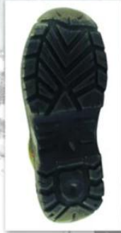
Sole style: 2000