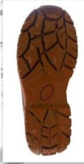
Sole style: 2015