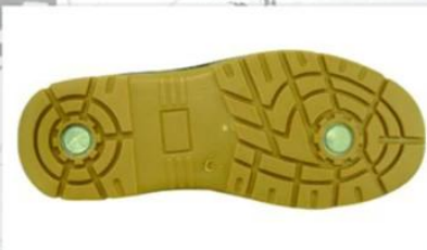
Sole style: 1000P