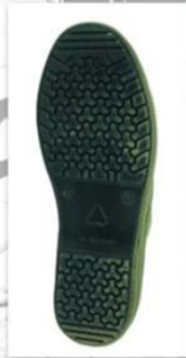
Sole style: 7000