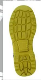
Sole style: 9000