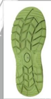
Sole style: 5000