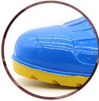
Waterproof PVC upper