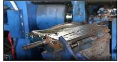
3. PVC Injection