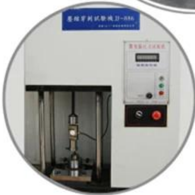
Puncture Testing Machine