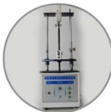
Tensile testing machine

Productieproces van pvc regenlaarzen. Onze regenlaarzen bieden goede prestaties en bescherming op het werk voor werknemers. Op maat bedrukt logo.