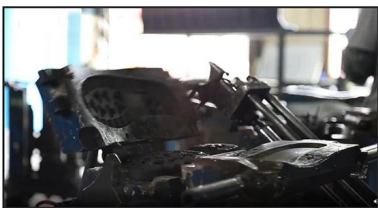
4. Open The Mould