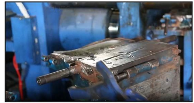
3. PVC Injection