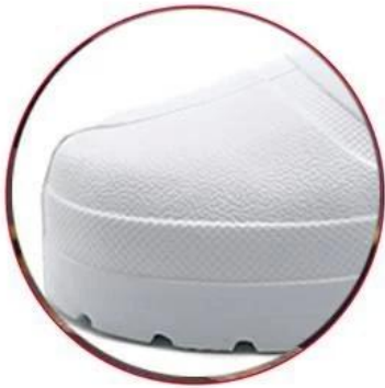
Waterproof EVA upper