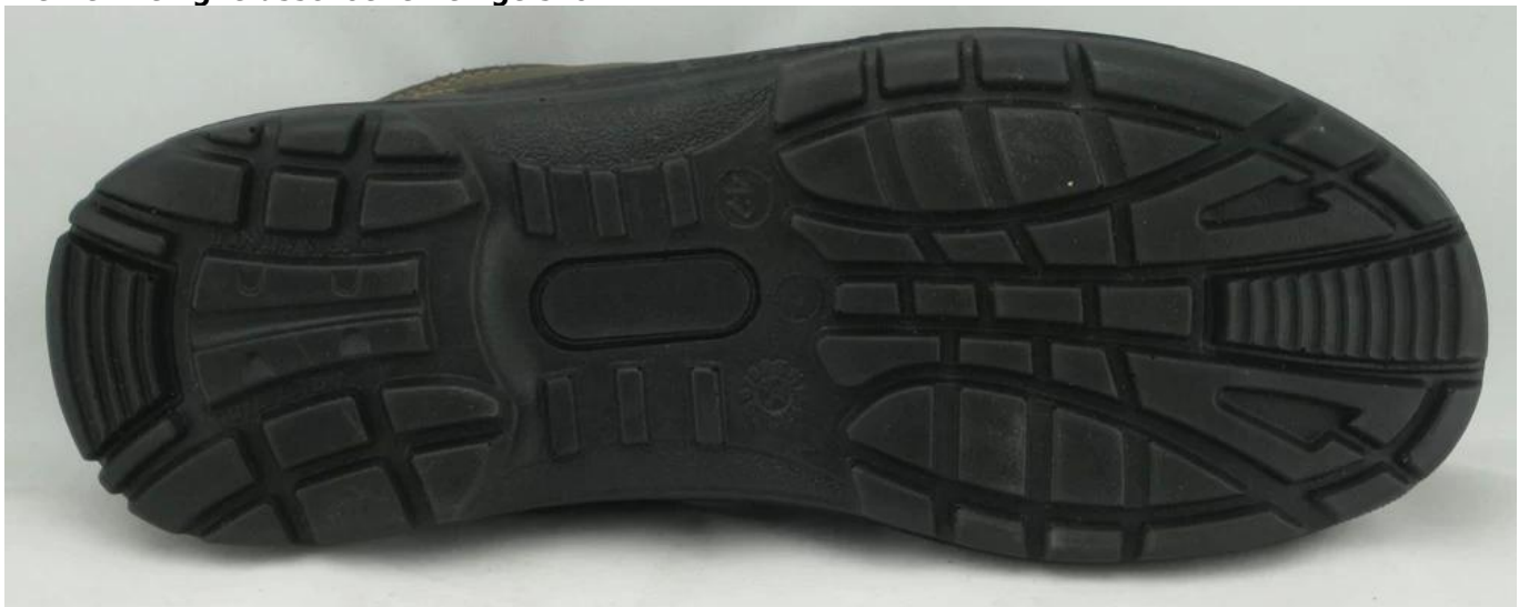
Werken veiligheidsschoenen enige model show: