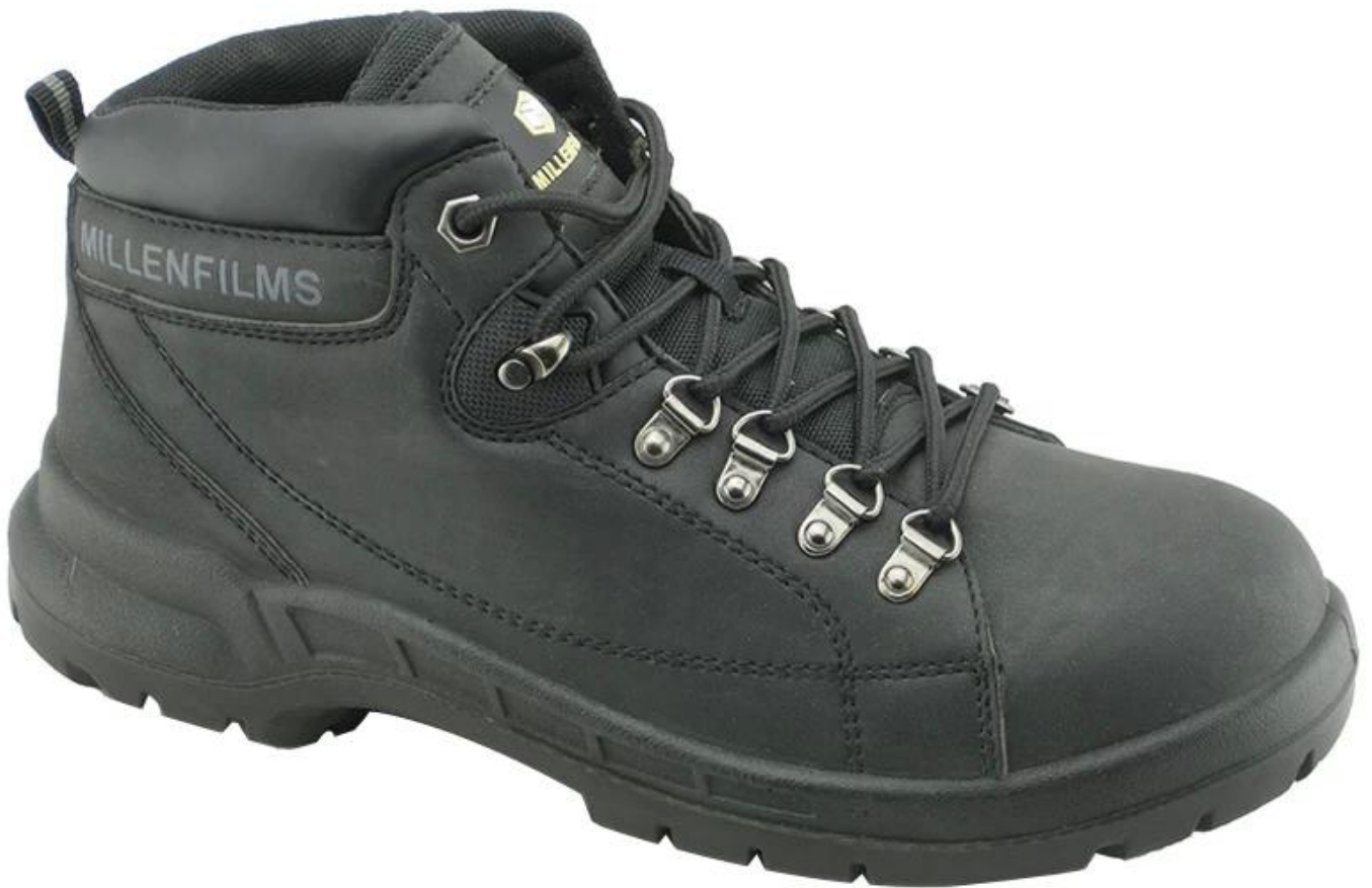
Werken veiligheidsschoenen enige show: