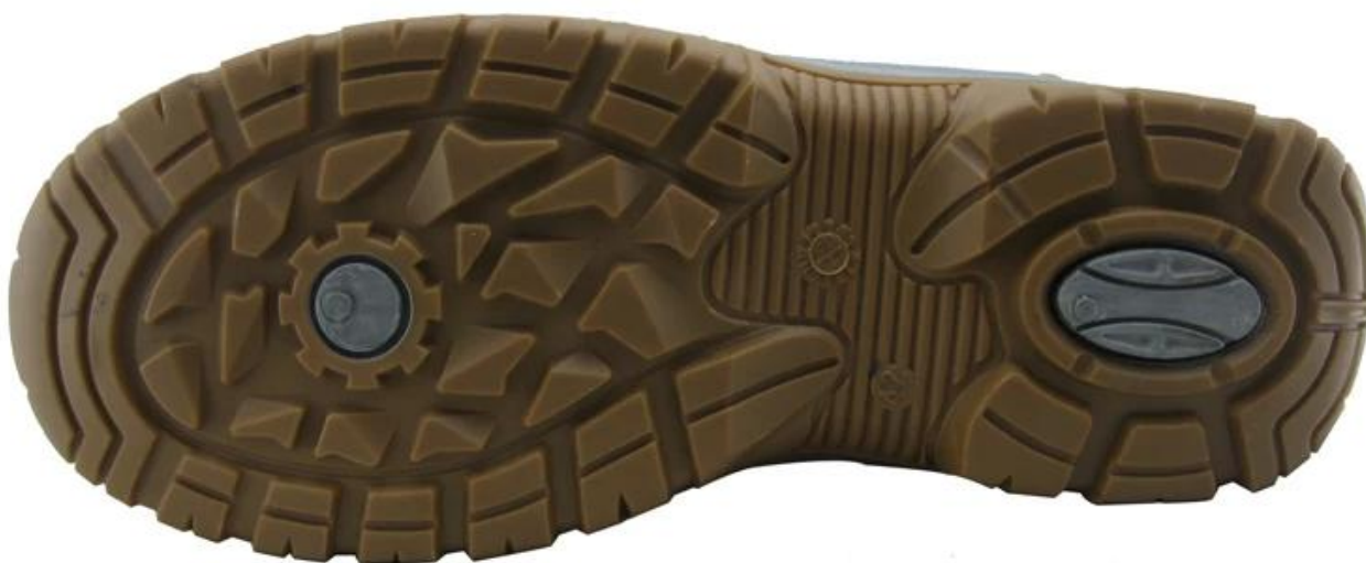
Veiligheidsschoenen enige model show: