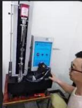
Bondness Test \geq 4.0 N/mm