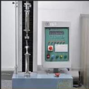
Tear Strength \geq 120N