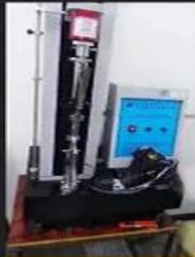
Bondness Test \geq 4.0N/mm