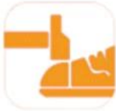
200 JOULE TOECAP