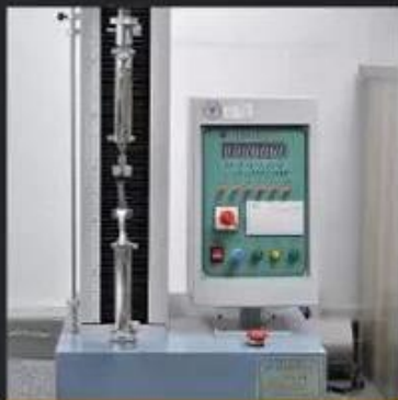
Tear Strength \geq 120N