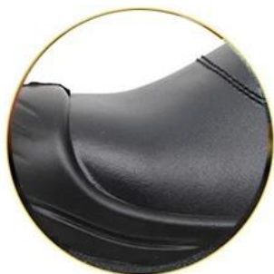
Waterproof leather upper

Removable metatological HI-POLY footbed provides long-lasting underfoot support and comfort.