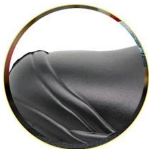
Waterproof leather upper

Removable metatomical HI-POLY footbed provides long-lasting underfoot support and comfort.