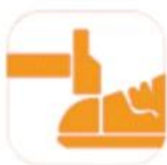
200 JOULE TOECAP