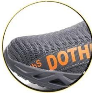
Breathable 3D fly knit fabric