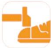
200 JOULE TOECAP