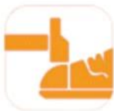
200 JOULE TOECAP