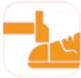
200 JOULE TOECAP