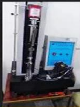
Bondness Test \geq 4.0N/mm