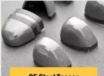
CE Steel Toecap