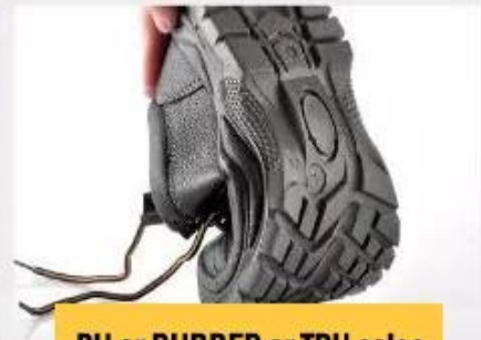
PU or RUBBER or TPU soles