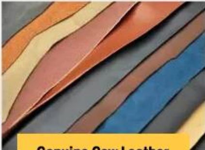
Genuine Cow Leather