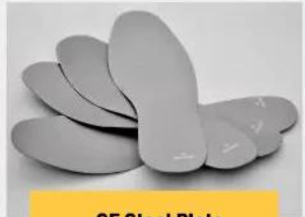
CE Steel Plate