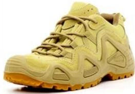
Safety Work Shoes

Link to PPE products website https://china-workwear.com