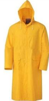
Rain Coat/ Suit