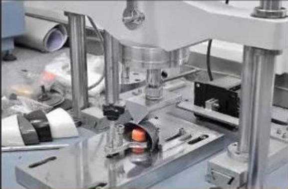
Toecap Test \geq 200 Joules