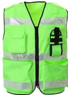
Reflective Safety Vest