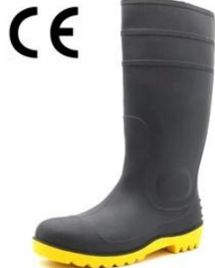
PVC Rain Boots