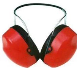
Ear muff/ Plugs