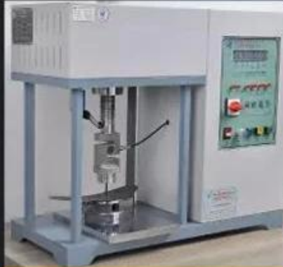
Midsole Test \geq 1200 Newtons