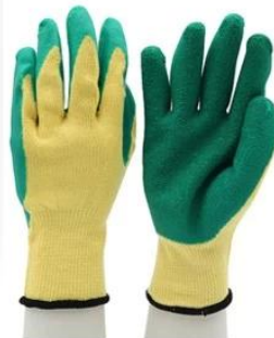
Safety Work Gloves