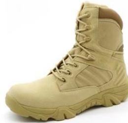
Military Army Boots