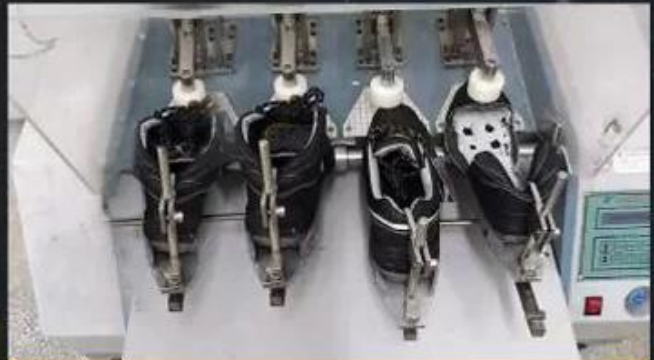
Flex Tester \geq 36,000 T