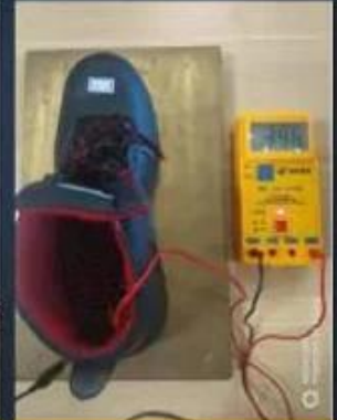
ESD Anti-Static Test