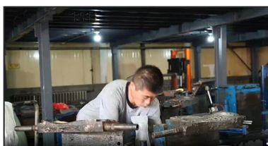
2. Putting Polyester Lining