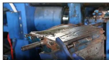
3. PVC Injection