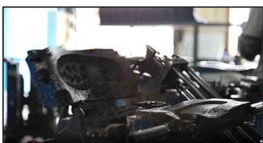
4. Open The Mould