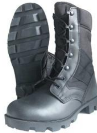
Military Army Boots