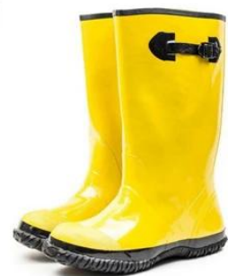
Yellow Slush Boots