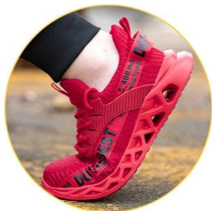
Breathable Mesh Upper

Breathable & Comfortable Uppers Compared with the traditional steel toed leather shoes , the fly weavingshoes are more breath and comfortable , and it will better fit your feet.