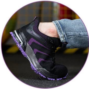
Breathable Mesh Upper

Breathable & Comfortable Uppers Compared with the traditional steel toed leather shoes , the fly weavingshoes are more breath and comfortable , and it will better fit your feet.