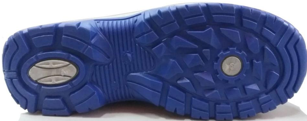
sapatos de segurança único modelo mostra: