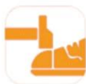
200 JOULE TOECAP