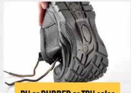
PU or RUBBER or TPU soles