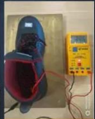
ESD Anti-Static Test