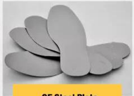
CE Steel Plate