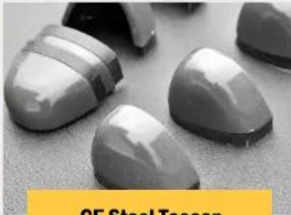
CE Steel Toecap