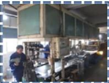
Heat - Setting