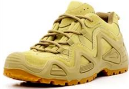
Safety Work Shoes