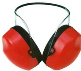
Ear muff/ Plugs