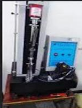
Bondness Test \geq 4.0 N/mm