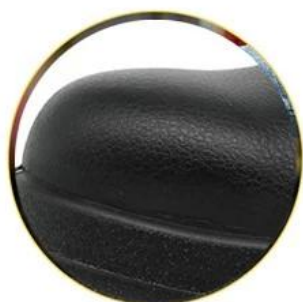
Waterproof leather upper

Removable metatomical HI-POLY footbed provides long-lasting underfoot support and comfort.