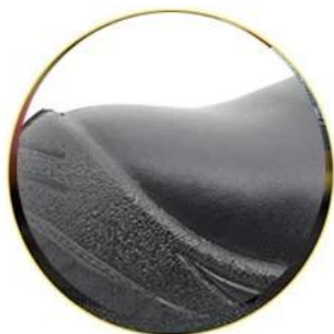
Waterproof leather upper

Removable metatomical EVA footbed provides long-lasting underfoot support and comfort.