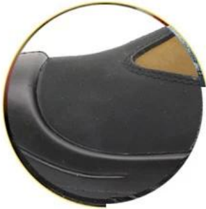
Waterproof leather upper

Removable metatomeal HI-POLY footbed provides long-lasting underfoot support and comfort.