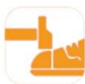
200 JOULE TOECAP