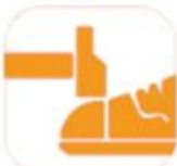
200 JOULE TOECAP