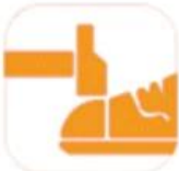
200 JOULE TOECAP